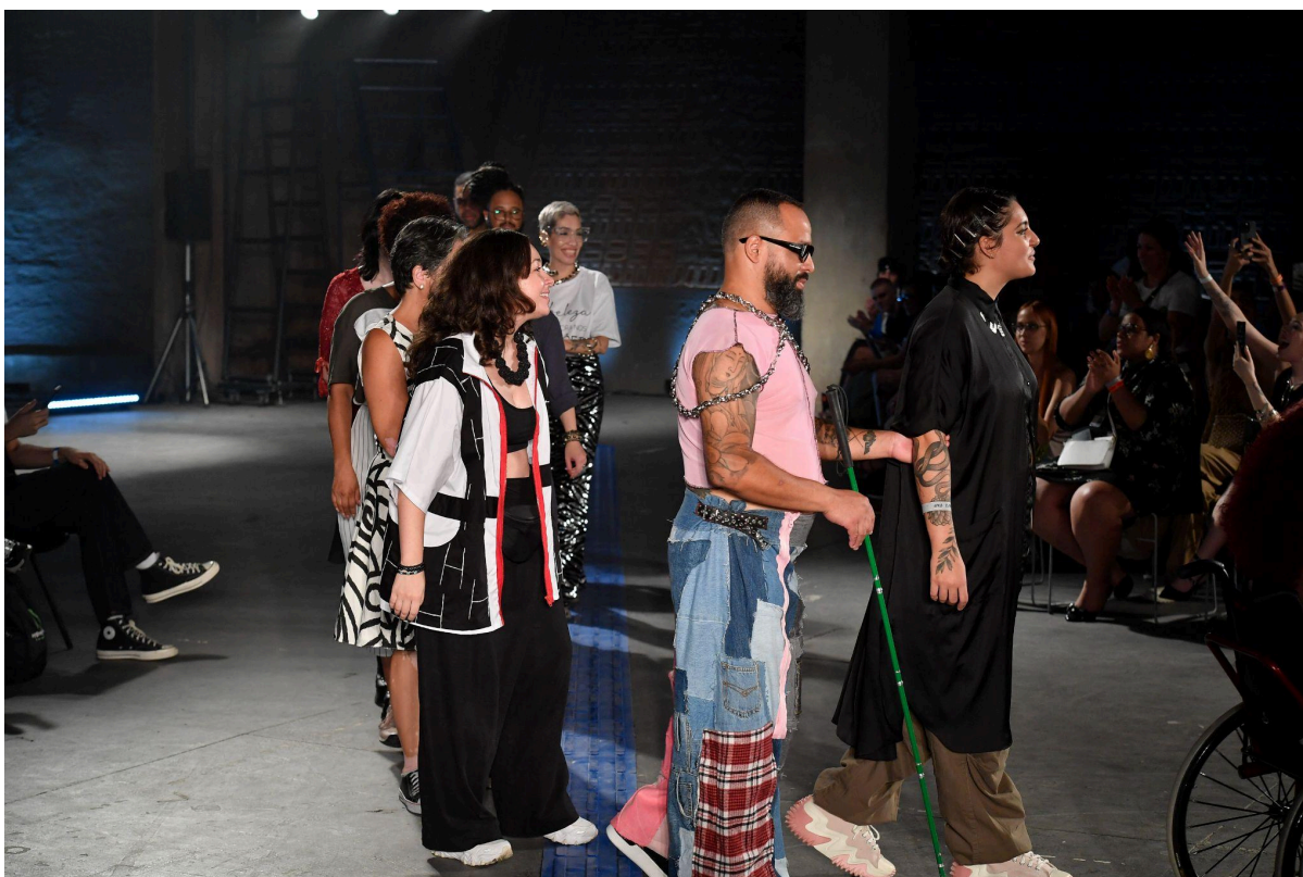
Desfile Moda Inclusiva

inovadoras e funcionais. O objetivo é mostrar que a inclusão no mercado da moda não exige grandes mudanças, mas sim adaptações simples que podem atender a uma grande parcela da população. Entre as inovações apresentadas, destaca-se também o Cabide Inteligente em Braille, uma ferramenta criada para promover mais autonomia nas lojas e na organização dos armários de pessoas com deficiência visual. O cabide facilita a escolha das peças e reforça o compromisso da Moda Inclusiva em atender todos os públicos, utilizando a moda como uma ferramenta de expressão e identidade.