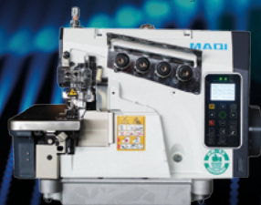
OVERLOCK ELETRÔNICA PONTO CADEIRA 2 AGULHAS MAQI X5C-4