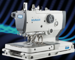
CASEADEIRA DE OLHO ELETRÔNICA C/ CORTE DE LINHA LONGO MAQI LS-T9820-01