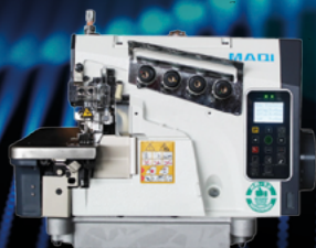
OVERLOCK ELETRÔNICA PONTO CADEIRA 2 AGULHAS MAQI X5C-4