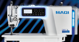
COSTURA RETA ELETRÔNICA C/ MOTOR DE PASSO MAQI Q5TT