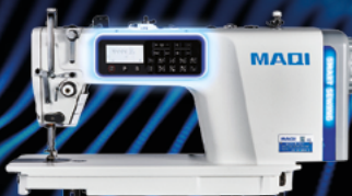
COSTURA RETA ELETRÔNICA C/ MOTOR DE PASSO MAQI Q5TT